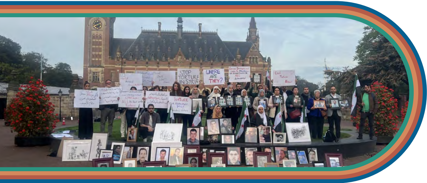
Holanda, Den Haag, Xwepêşandana Pêşîn a ICJ 10 Cotmeh 2023

Nivîsîna hejmarê: 2 || ji 1ê Çîrûskê 2023 heta 31ê Adarê 2024